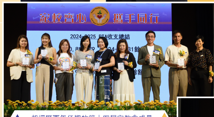
▲ 一起經歷兩年任期的第十四屆家教會成員