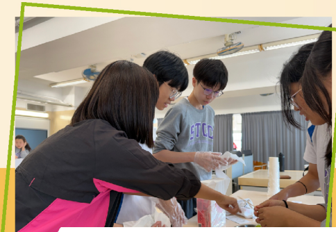
▲ Making Tanghulu with precision and care on STCC's info Day.

Through a dynamic array of activities, we empower students to envision their contributions not just to our school, but to the wider community. Guided by our motto, "Broaden our sight, soar with might," we are committed to nurturing a vibrant environment where students unite and engage passionately for the betterment of STCC and the society as a whole!