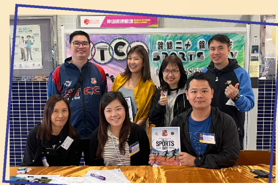
▲ PTA 家委在這兩天擔任接待處崗位

感謝 STCC讓家長們一同參與學校一年一度的運動會，不論是觀賽或參賽的家長，看到孩子在校園生活中的另一面，了解他們在學業以外的才能和興趣，見證孩子成長的喜悅時刻。各位運動健兒傾盡全力，鬥志昂揚，充分表現對運動的熱情。他們對比賽認真專注的態度，實在值得欣賞。還有看台上啦啦隊加油的吶喊聲、窩心的支持和鼓勵，各社濃厚的團隊精神和凝聚力都深深感動我。