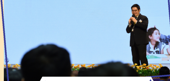
▲ 校長分享展開序幕