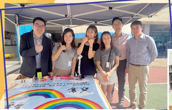
▲ 彩虹代表應許和祝福，每種顏色包含聖經金句

家教會設計生動有趣的攤位遊戲分享信仰，傳遞福音信息。老師和學生也樂在其中。家長們更為詩歌分享會合力扭製心形氣球及預備特飲，讓基督的愛充滿迦南的校園。