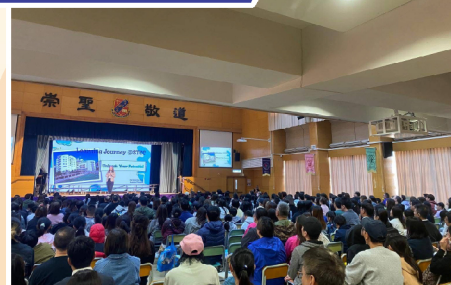
▼ 基督的愛激勵我們！