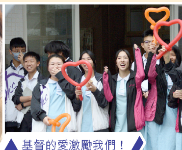
▲ 基督的愛激勵我們！