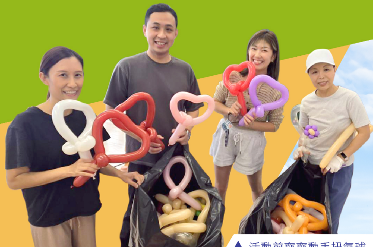
▲ 活動前齊動手扭氣球

家教會設計生動有趣的攤位遊戲分享信仰，傳遞福音信息。老師和學生也樂在其中。家長們更為詩歌分享會合力扭製心形氣球及預備特飲，讓基督的愛充滿迦南的校園。