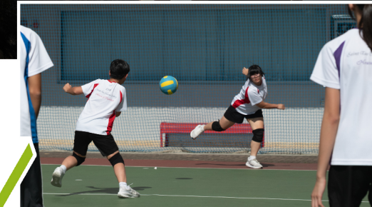
▲ Form 2 students try their very best to win a game in the S2 Inter-form Dodgeball Competition.

Serving as the Student Union has been an incredible journey of growth! We've learned so much—from organizing and promoting events in school to effectively communicating with various groups and collaborating as a team. Each member brings unique strengths, enabling us to support one another and truly excel in our roles.