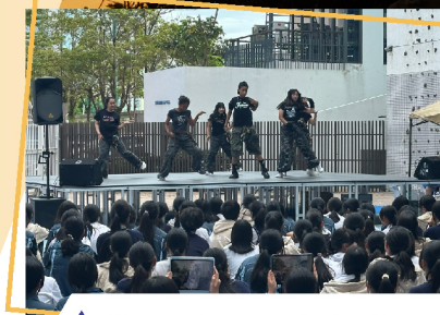
▲ It's our honour to be the guest performers in UCCKE's dance competition.