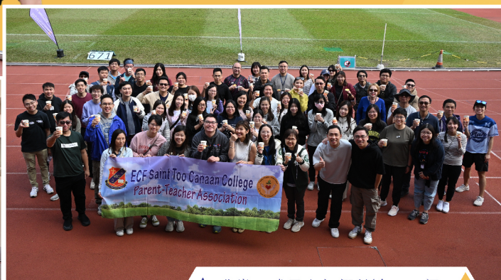
▲ 欣賞及感恩老師們營造了一個充滿關愛和正面的學習環境