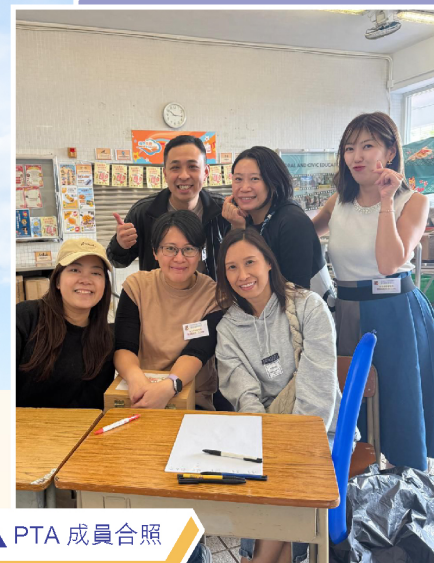
▲ PTA 成員合照

由活動前的籌備，到看見孩子對玩攤位遊戲的投入、認真讀聖經金句、領取特飲時的笑容，都是這個活動中溫暖的回憶。感謝學校給予機會及家委們的通力合作。