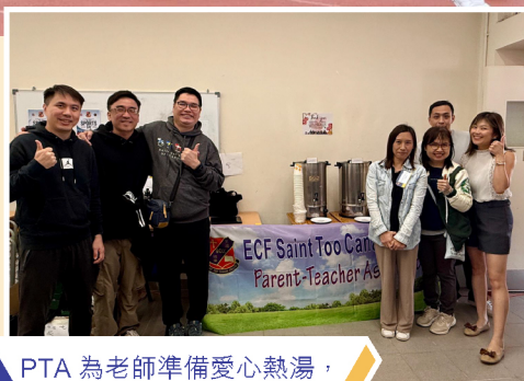
▲ PTA 為老師準備愛心熱湯，為老師們打打氣