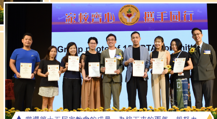
▲ 當選第十五屆家教會的成員，為接下來的兩年一起努力