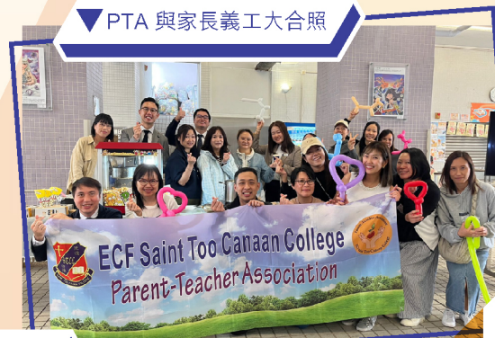
▼ PTA 與家長義工大合照

作為家教會的一份子，我們非常高興能夠為來賓準備貼心的小食和飲品，為整個 Info Day 增添一份溫暖及人情味。在迦南這個重要的日子，真的令人難以忘懷，感動不已！