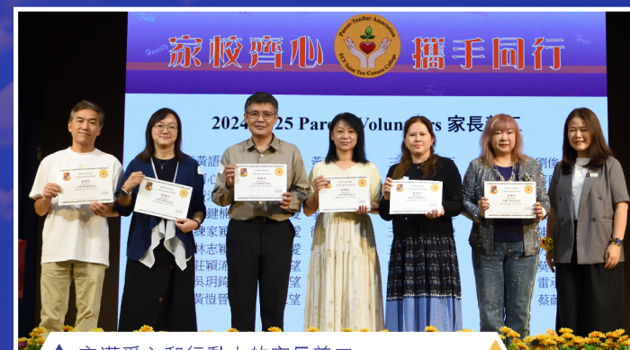
▲ 充滿愛心和行動力的家長義工

感謝 投票支持我「連任」的老師和家長，能夠再次與一班熱心家長為學校服務，是我的榮幸。每次出席家教會的會議和活動，都讓我體會到迦南重視家校合作。除了感激家教會委員，亦感恩學校有一群默默付出的家長義工，積極參與不同活動，為學校出一分力。