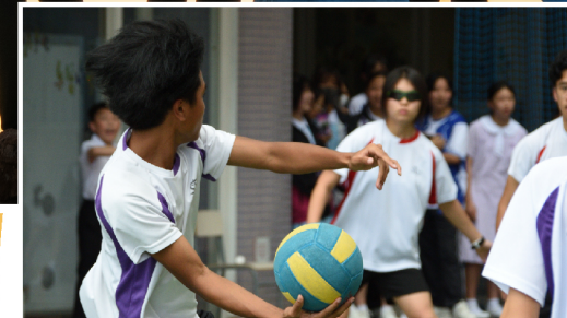
▲ Students participate wholeheartedly in a game of dodgeball at the Inter House Ball Games.